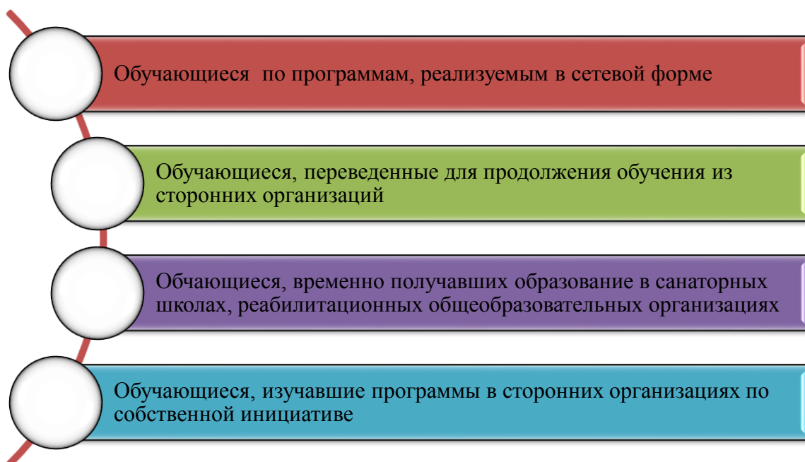
Рисунок 1 – Актуальные случаи зачёта результатов освоения обучающимися учебных предметов, курсов, дополнительных образовательных программ в других образовательных организациях

Локальный нормативный акт представляет собой правовой документ, содержащий общеобязательные правила поведения для всех или некоторых работников организации и (или) обучающихся, их родителей (законных представителей), рассчитанный на неоднократное применение. Функция локального нормативного акта - детализация, конкретизация, дополнение, а иногда и восполнение общей, правовой нормы применительно к условиям данной образовательной организации, с учетом имеющихся особенностей, специфики образовательного процесса и иных условий.